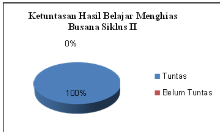
Gambar 2. Pie Chart Ketuntasan Hasil Belajar Menghias Busana Siklus II

Untuk dapat melihat lebih jelas tentang ketuntasan hasil belajar siswa kelas XI-A Tata Busana Negeri 3 Metro pada siklus II maka dapat dilihat pada diagram sebagai berikut :